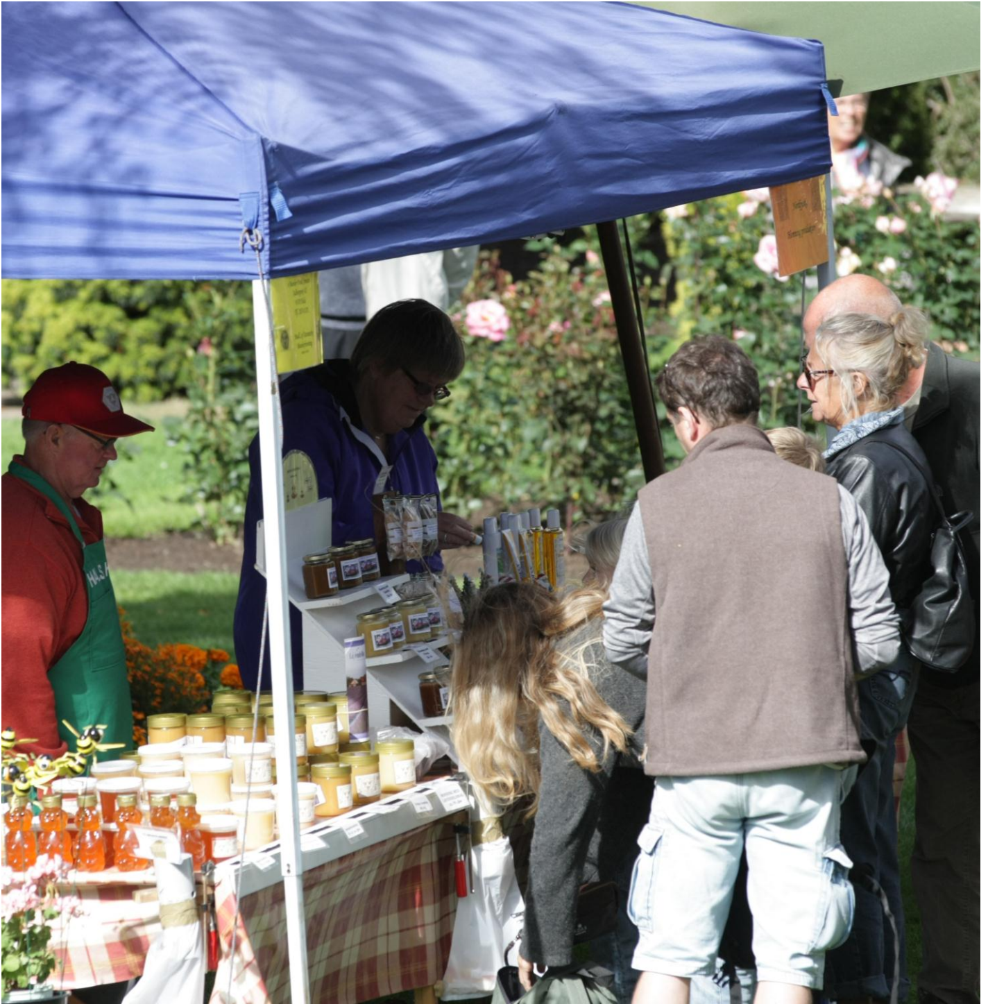
Honningfestivalen 2013 i Jesperhus Blomsterpark