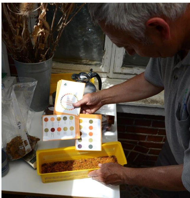
Hver tredje uge indsamles pollenprøver fra bifamilier.

Herudover er der udviklet en ny varroa-hjemmeside, Varroa.dk, som skal forbedre tilgængeligheden af viden om varroamider og deres bekæmpelse, samt præsentere nye muligheder for selvstudier og tests, som forhåbentlig kan sprede viden blandt biavlere på en moderne og pædagogisk måde.