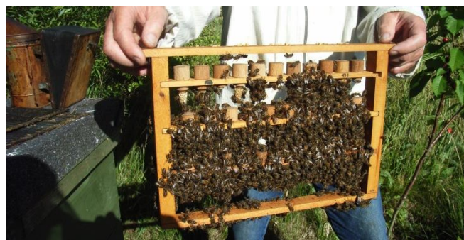
Test af brugsdronninger kan styrke målene for avlen.

Med baggrund i en lidt trist sag med flytning af bier til en renparringsstation med et erstatningskrav til følge har fagligt udvalg udarbejdet en Powerpoint om renparringsstationer til undervisningsbrug i lokalforeninger.