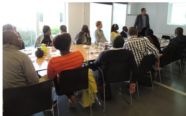
Studerende fra VALOR-projektet på besøg i Danmark.