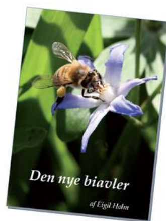
Ny undervisningsbog med levende bier.

Egil Holm har i samarbejde med DBF udgivet en ny lærebog for nye biavlere, 'Den nye Biavler', som ligger i forlængelse af det kursusmateriale som DBF udarbejdede for nogle år siden.