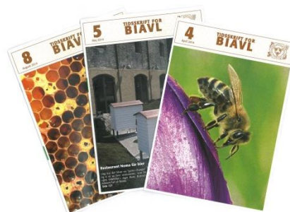
Tidsskriftet som hver måned lander hos landets biavlere.

skriftet, vil vi benytte lejligheden til at sige tak til jer der indsender artikler til dette. Vi mangler til stadighed den gode historie fra den enkelte biavl og lokalforeningerne. En stor tak til dem der vil bruge tid på at være skribent af månedens arbejde, det er en stor opgave, men en af de vigtigste og mest læste. Vi søger til stadighed skribenter til denne opgave, så sig til hvis I har lyst.