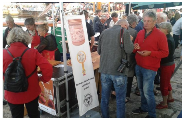
Uddeling af Jordbær og nyslynget honning ved Folkemødet på Bornholm.

Forslaget fokuserer på at der omkring en økologisk bigård skal være et tilstrækkeligt fødegrundlag for bierne i form af økologiske afgrøder, vild bevoksning eller naturområder behandlet efter miljøskånsomme metoder. Det er et stort paradoks, at det hidtil ikke har været muligt at producere økologisk honning på økologisk dyrkede landbrugsområder, blot fordi der f.eks. har været en konventionelt dyrket kornmark indenfor 3 kilometers afstand. Konventionel rapsproduktion er stadig en udfordring, som ifølge forslaget kan imødegås af en økologisk rapsproduktion tættere på bigården.