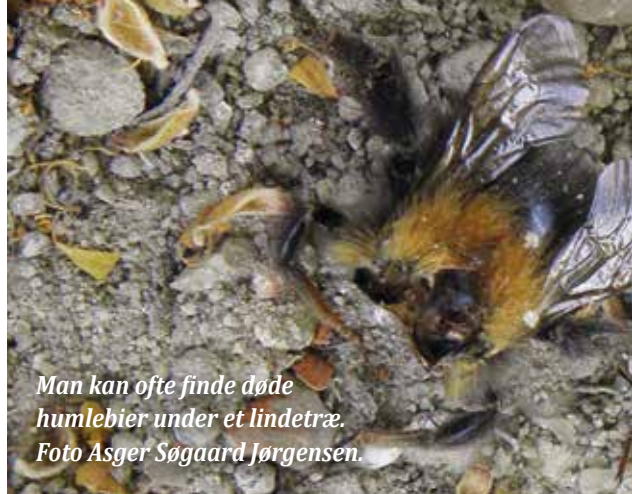
Man kan ofte finde døde humlebier under et lindetræ.

fik dækket 2% af deres energibehov. Humlebiene var med andre ord ikke døde af nektaren, men nærmere på grund af mangel på nektar.