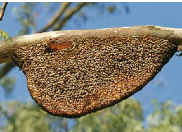
Et frithængende Apis dorsata bo.

At tavlen hænger frit gør, at boet er meget udsat overfor bl.a. angreb fra rovdyr. For at kompensere for den udsatte placering, er vagtbierne nødt til konstant at være på vagt overfor mulige trusler i boets omgivelser. Samtidig skal vagtbierne være i stand til hurtigt og effektivt at vurdere, hvorvidt et objekt er en reel trussel eller ej. Vagtbierne udsættes hyppigt for objekter, som passerer tæt forbi boet – det kan f.eks. være blade og kviste som falder ned fra trækronen. Form, størrelse og faldhastighed varierer betydeligt mellem f.eks. blade, grene og kviste. Det eneste disse plantedele har til fælles, er at de bevæger sig nedad. Informationen om at et objekt bevæger sig nedad, bruger bierne muligvis til at opfatte objektet som uskadeligt for boet.