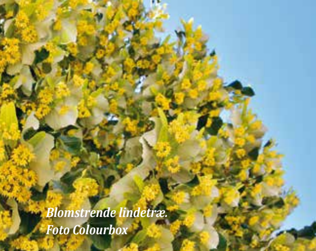
Blomstrende lindetræ.