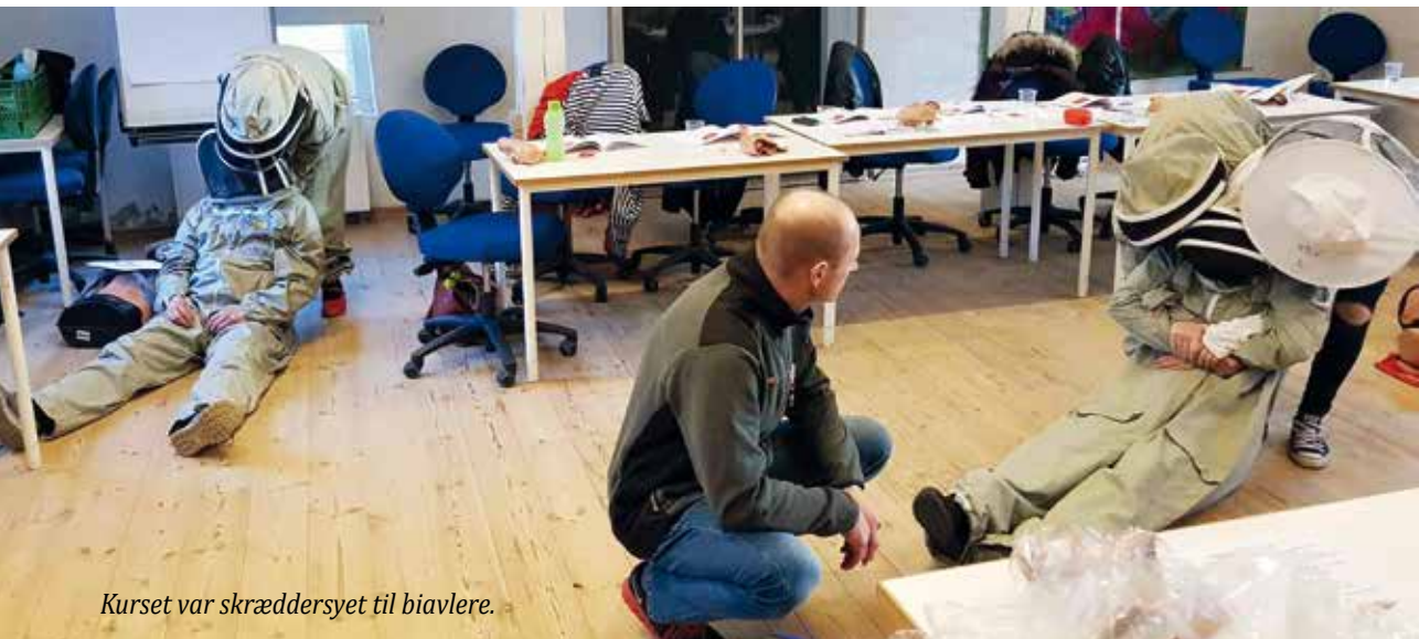
Kurset var skræddersyet til biavlere.

Nordsjællandske Bivener har afholdt et førstehjælpskursus i Dansk Røde Kors regi, specielt skræddersyet til en biavlerforening. Det kan anbefales.