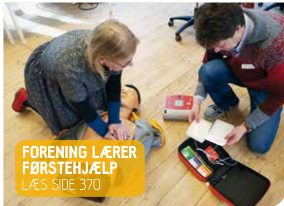
FORENING LÆRER FØRSTEHJÆLP LÆS SIDE 370