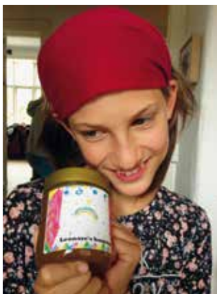
Høsten vises stolt frem - og jo, det er urørt honning.

Efter presning, lagde vi den pressede honning op i en grov si, og med en fin si under. Det tager tid at lade honningmosten dryppe af. Hos os tog det ca. et døgn af få honningen siet, da det var en tør sensommerhon-