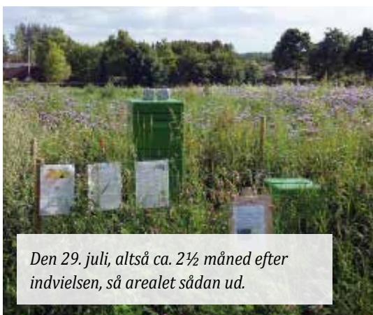
Den 29. juli, altså ca. 2½ måned efter indvielsen, så arealet sådan ud.