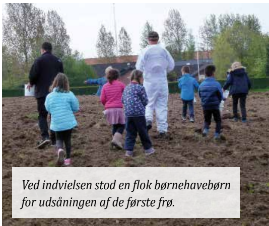
Ved indvielsen stod en flok børnehavebørn for udsåningen af de første frø.