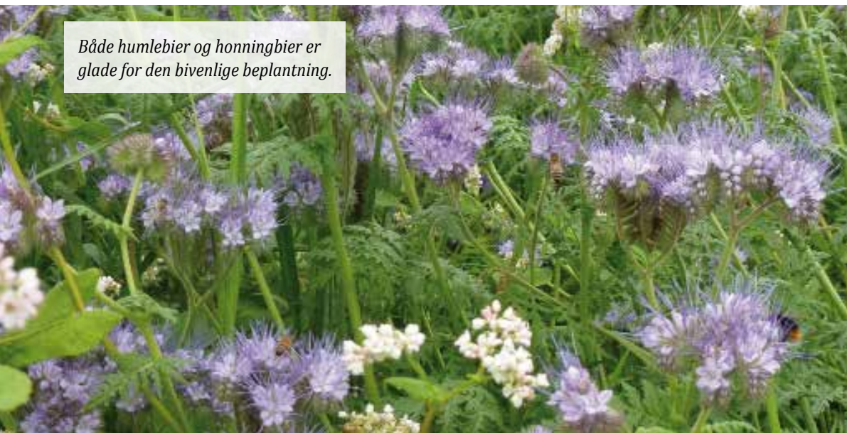
Både humlebier og honningbier er glade for den bivenlige beplantning.