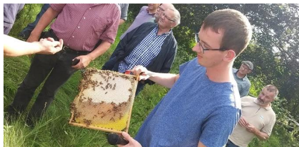
ERFA-dag hos HF-honning.

ERFA-dage hvor biavlerne har mest travlt, er nok ikke optimalt. Vi aflyste grundet for få tilmeldinger. Det er vigtigt, at vi åbner vores døre for hinanden og viser åbenhed. Det er den bedste måde at lave erfaringsudveksling på. Det giver snak, dannelse af netværk og erfaringsudveksling, som der kan bygges på fremover.