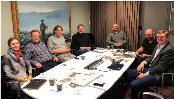
Planlægning af vores bud på Apimondia 2025 sammen med Norge og Sverige.

I september 2019 blev Apimondia-kongressen afholdt i Montreal. Mere end 20 danskere deltog i kongressen, der var meget velbesøgt af mange forskellige lande. Det lykkedes sammen med vores kollegaer fra Sverige og Norge, at få gjort opmærksom på vores kandidatur til Apimondia 2025.