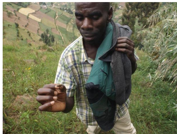
Lokal biavler viser bidronning frem.

Igennem de sidste 30 år har Danmarks Biavlerforening været ansvarlig for forskellige biavlsprojekter i 3. verdens lande. Det har været i Gambia, Guinea Bissau, Tanzania, Dominica, Indien og Vietnam. I disse projekter har Danmarks Biavlerforening samarbejdet med lokale NGO'er og projekterne har været finansieret af eksterne midler.