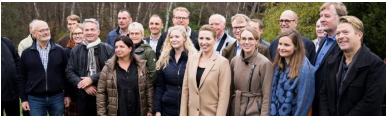
Naturmøde på Marienborg

Ved mødet blev det af statsministeren fremhævet at bierne er forudsætningen for meget af det andet, samt at vi skal have mere natur, mere urørt natur og mere sammenhængende natur. Samtidig pegede hun på, at Danmark har behov