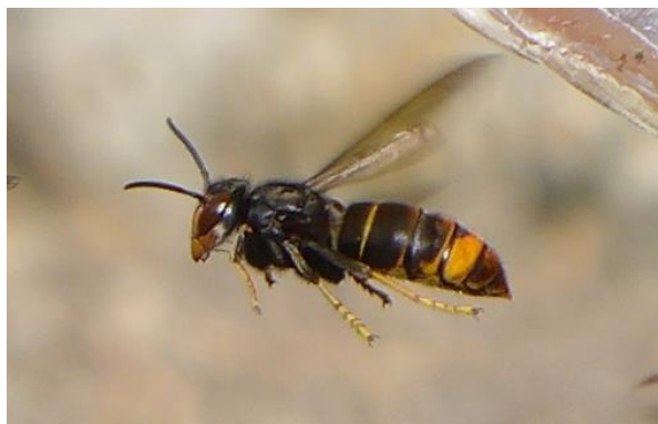
Vespa velutina

Den gulbenede asiatiske gedehams er for nuværende etableret i Italien, Spanien, Portugal, Frankrig og Belgien. Den er endvidere observeret i England og Tyskland.