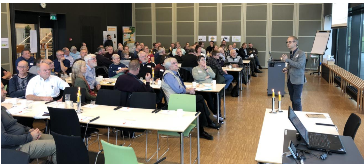
Branchemøde om situationen på honningmarkedet

Biernes absolut mest værdifulde produkt er bestøvning af vores afgrøder. Dette område understøttes af vores indsats omkring bestøverportalen. Dette sker i samarbejde med Landbrugsstyrelsen, Landbrug&Fødevarer og de øvrige biavlorganisationer.