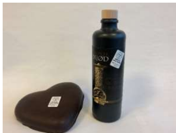
Den nye etiket "Indeholder dansk honning".

honninggrossisten Jakobsens A/S. Ugen efter havde Danmarks Biavlerforening et møde med bl.a. selskabets direktør, og det blev oplyst at selskabet i en ny strategi ville bringe naturlige, nordiske fødevarer ud til forbrugere i Norden og i resten af verden. Mødet gav en god dialog om honningmarkedet og prioriteringerne hos såvel Good Food Group som Danmarks Biavlerforening. Danmarks Biavlerforening finder det vigtigt at samarbejde bredt, og at have en dialog med alle i erhvervet. Således også med forhandlere og distributører af honning. Foreningens fokus vil i denne sammenhæng være at skabe de bedst mulige forhold for landets biavlere. Således arbejdes der også på gennemførelse af en workshop, om hvordan dansk honning kan fremhæves i Danmark og eventuelt på andre markeder.