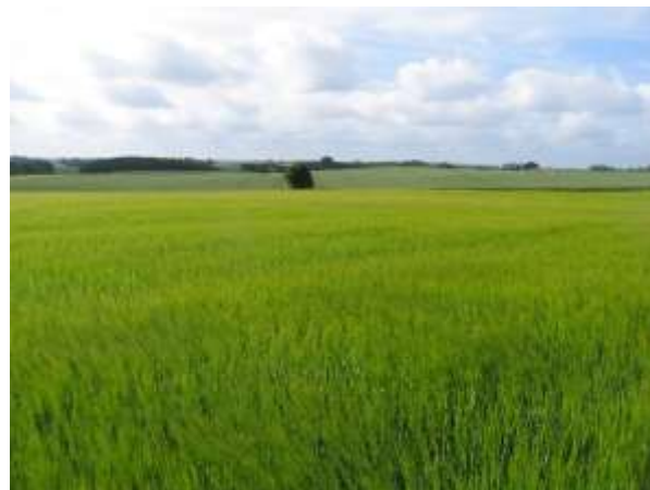
Der er behov for mere variation i det åbne land.

Udvalget vil arbejde videre med at synliggøre fejl i sådanne processer og ligeledes arbejde for mere konstruktive processer for beskyttelse af alle bestøvere.