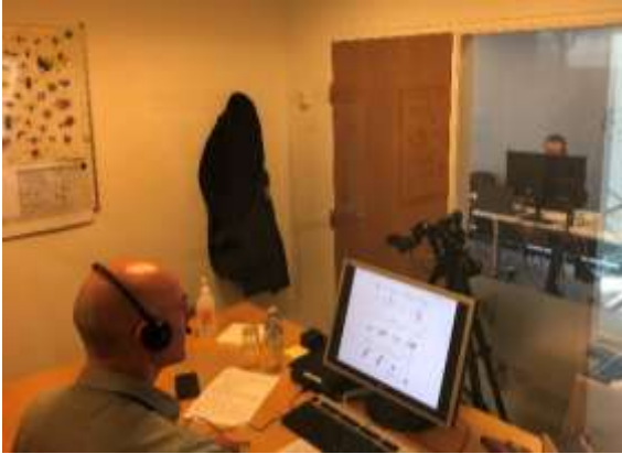
Den virtuelle gennemførelse af Biavlskonferencen.