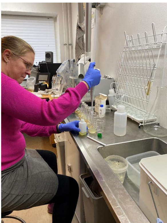
Opgaverne i sekretariatet er mangeartede.

Sekretariatet består af i alt ti medarbejdere, hvilket både dækker over fuldtidsansatte og deltidsansatte. På den måde sikres det, at vi har de bedst mulige kompetencer til de mange forskellige opgaver.