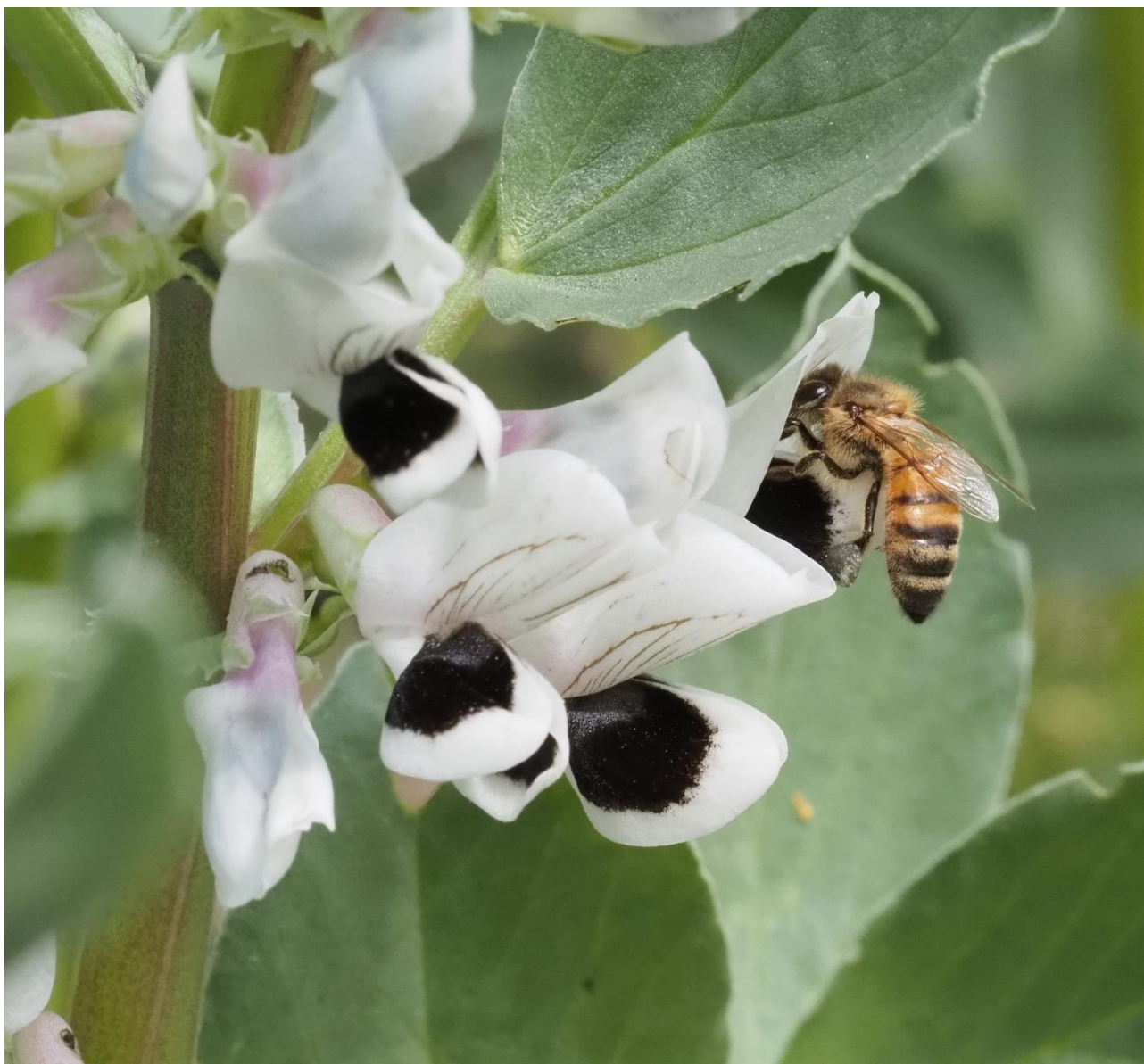
Bibestøvning af hestebønne.

Projektet har til formål at uddanne danske biavlere til at nyudvikle produkter og blive bedre på afsætning af biernes produkter. I løbet af året er der blandt andet afholdt erfaringsdag for erhvervsbiavlere og der er udgivet temahæfte med tilhørende online værktøjskasse.