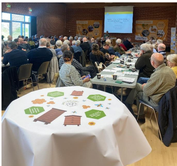
Lokale bestyrelsesmedlemmer fra hele landet samlet til Lokalforeningsseminar.

Om eftermiddagen kunne deltagerne vælge sig ind på en workshop om hhv. fundraising, messestanden, sociale medier i foreningerne og hvordan man engagerer flere frivillige i foreningerne.