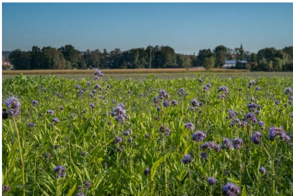
En del af landbrugsstøtten øremærkes bio-ordninger.

husdyr, hvor det er muligt at opnå etableringsstøtte. Danmarks Biavlerforenings forslag er imødekommet, og biavl er nu nævnt i vejledningen som en støttebe-rettiget aktivitet.