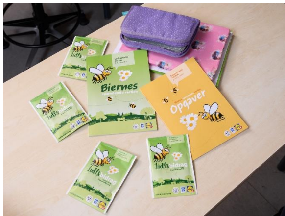
Undervisningsmaterialet til skolernes 2. – 4. klassesetrin.

I februar 2022 udkom et nyt spændende undervisningsmateriale til skolernes 2. – 4. klassesetrin. Materialet, som er udarbejdet af Lidl og Danmarks Biavlerforening, skal gøre elever klogere på biers livsbetingelser og deres store betydning for bestøvning af afgrøder. Materialet, der er gratis, var revet væk på meget kort tid, så derfor valgte Danmarks Biavlerforening at genoptrykke læringshæftet og opgavehæftet. Materialet findes også elektronisk.