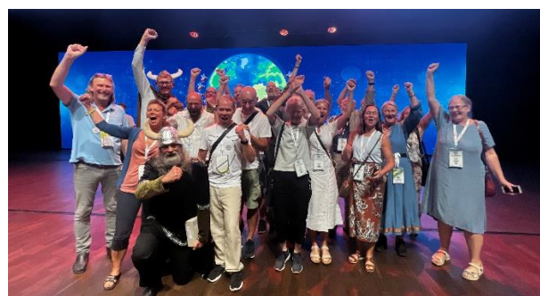
Sammen med Sveriges Biodlares Riksförbund og Norges Birøkerlag vandt vi værtskabet for Apimondia-kongressen i 2025.

Glæd jer til fem dage, hvor I ikke behøver at tænke på andet end bier og samvær med andre biavlere fra hele verden fra morgen til aften.