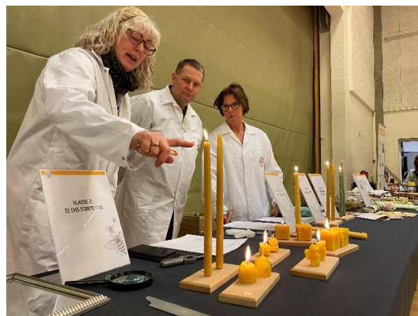
Dommerteamet bedømmer de indleverede vokslys.

i løbet af weekenden i konferencen, og det er en fremgang fra sidste år. Konferencen bød på en række spændende og inspirerende foredrag og workshops og sideløbende var der en udstilling med en bred vifte af stande. Sidste år blev forskellige konkurrencer introduceret på konferencen. Ud over lys og honningkager var konkurrence-kategorierne i år udvidet med innovative opfindelser og bee wraps.