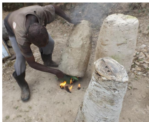
Fremstilling af bikuber hos Batwa-folket i Uganda.

I 2020 fik Danmarks Biavlerforening sammen med organisationen Bees for Development opnået støtte fra CISU (Civilsamfund i Udvikling) til et projekt i Uganda med det formål at hjælpe nogle af landets ca. 6.000 Batwa-pygmæer. I april 2022 kørte en kampagne, hvor danske biavlere og andre interesserede havde mulighed for at donere penge til projektet. Donationerne var med til at sikre, at flere Batwaer får en biavleruddannelse. Der blev i løbet af kampagnen indsamlet 33.000 kr.