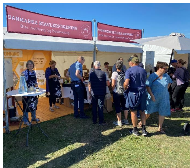
Lokale biavlere på Food Festival i Aarhus.

Biavlen har takket være stort engagement fra lokalforeninger og lokale biavlere være meget synlig ved udstillinger, folkemøder og messer i den forgangne periode. I løbet af året var biavlen bl.a. repræsenteret ved: Tivoli Food Festival, Naturmødet, Roskilde Dyrskue, Madens Folkemøde, Folkemødet (Bornholm), Fynske Dyrskue, CPH-garden, Landsskuet Herning, Spejdernes Lejr, Food Festival (Aarhus) og Mjødens Dag. Danmarks Biavlerforening yder tilskud til standleje, materialer, adgangskort til involverede og aktiviteter, såfremt der er tale om landsdækkende og landsdelsarrangementer. Hvis der sælges honning fra standen skal fortjenesten naturligvis modregnes, eller arealet til honningboden skal modregnes.. I tilfælde hvor der ønskes deltagelse af bestyrelsesmedlemmer eller medarbejdere kan disse inviteres til dele af arrangementet. Uanset om der er tale om små lokale events eller store landsdækkende events bidrager foreningen altid gerne med oplysningsmateriale og evt. udlån af udstillingsmaterialer.