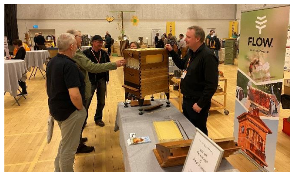
Udstillingen på Dansk Biavlskonference 2024

Eftermiddagen bød på 4 spændende workshops. Her kunne deltagerne vælge mellem følgende fire emner: • Synlighed i den lokale presse • Verdenskongressen Apimondia 2025 • Samarbejde med skoler • Lokal interessevaretagelse i kommunerne.