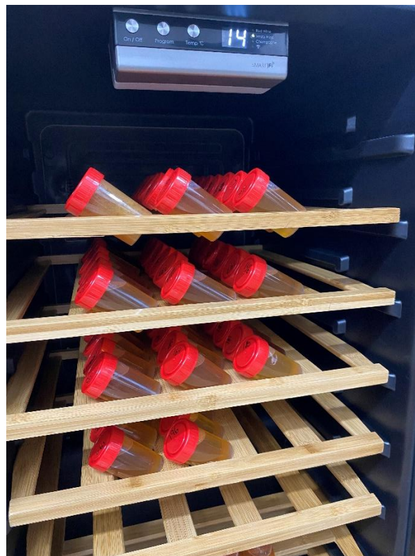
I projektet "Kvalitetsforbedring af biavlprodukter" vurderes honningernes evne til at holde sig flydende.

Projektet gennemføres i perioden 2023-2026 via støtteordningen "Projekter i sektoren for biavlprodukter".