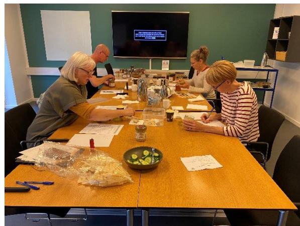
Dommerpanelet i fuld gang med at vurdere de deltagende honninger ved DM i honning 2023.