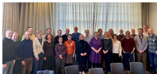
Cirka 25 personer fra Norge, Sverige og Danmark deltager i den overordnede planlægning af verdenskongressen 2025.

Arbejdet med at planlægge Apimondia 2025 er i gang. Til dette formål er der etableret en planlægningsorganisation bestående af ca. 25 personer fra Norge, Sverige og Danmark.