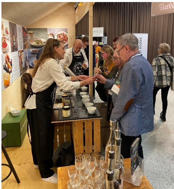
Danmarks Biavlerforening var synlige overfor fødevarerbranchen ved FoodExpo 2024.

Dette var eksempelvis tilfældet i marts 2024, hvor fødevaremesse FoodExpo blev afholdt i Messecenter Herning. Her blev der i samarbejde med mjødbryggere og medlemmer af Pollen og Propolisforeningen uddelt smagsprøver af honning, mjød og bipollen til kokke, restauratører og andre fra fødevarebranchen.