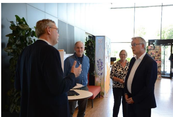
Besøg af fødevarerminister Jacob Jensen i august 2023.

Danmarks Biavlerforening havde i august besøg af Minister for Fødevarer, Landbrug og Fiskeri Jacob Jensen. Her forklarede vi om biernes betydning for bestøvning af landbrugets afgrøder, herunder hestebønner, hvor studier viser, at biernes bestøvning øger udbyttet med op til 40 %. Ministeren var meget interesseret i emnet og nok også overrasket over, hvor stor betydning biernes bestøvning har for en bæredygtig fødevarerproduktion.