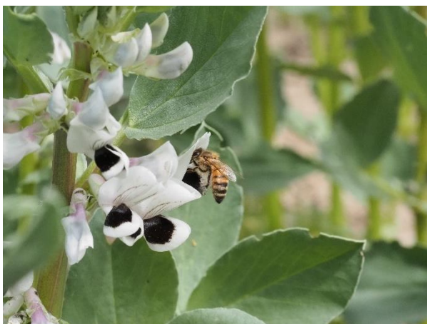
Honningbi på besøg i hestebønneblomst.

I undersøgelserne af lupin var der også stor aktivitet af bier, men primært humlebier. Udenlandske undersøgelser har vist, at humlebiernes bestøvning af Lupin kan medvirke til øget proteinindhold. For nuværende er der ikke basis for at anbefale honningbier til lupin, men med tiden kan nye forhold måske vise sig.