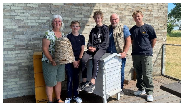
Årets deltager ved IMYB, og de voksne ledsagere.

B-THENET er et 4-årigt EU-projekt som startede i sommeren 2022 og involverer 18 europæiske partnere. Projektet tager udgangspunkt i biavleren. Vi har i projektet spurgt biavlerne, hvordan de driver deres biavl og hvor tilfredse de er med det. Derefter sammenlignes praksis imellem landene. For første gang nogensinde sammenlignes og dokumenteres de metoder, som de europæiske biavlere anvender.