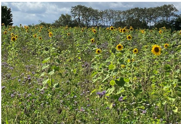
Mange brakmarker har stået i blomst de seneste år.

Danmark har som det eneste land i EU indført kravet 4 % ikke-produktive arealer, og i foråret indførte EU en forenkling, der fjernede kravet. Gennem en aktiv indsats sammen med andre grønne organisationer lykkedes det at presse på for en fastholdelse af kravet i Danmark. Dette er foreløbig gældende til og med 2025.