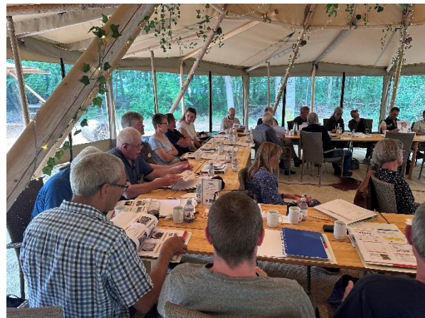
Nye instruktører i honningbehandling får gennemgået undervisningsmateriale.

Jylland og på Sjælland. Instruktørkurserne indebar både faglig viden om de pågældende emner, introduktion af kursusmateriale, sparring med andre lokalforeninger og praktiske eksempler på aktiviteter.