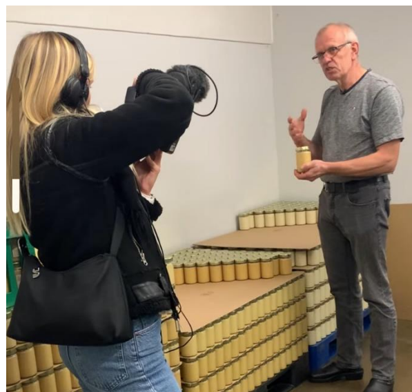
Erlings honningeksport fra Rømø kom i medierne.

Send gerne et tip til sekretariatet, hvis I har en god historie, der fortjener god opmærksomhed.