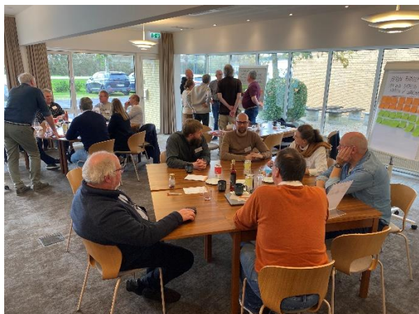
Workshop, hvor bestyrelsen havde inviteret nogle biavlere og grossister til at give deres input til bedre afsætning i fremtiden.

Workshopsene gav virkelig gode input, som har dannet grundlag for bestyrelsens forslag til markedsføringsstrategi.