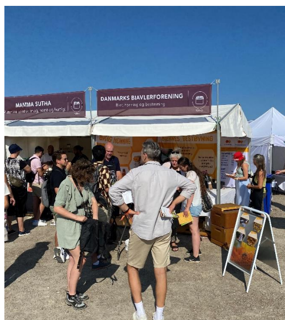
God interesse for at smage honning ved biavlernes stand på Aarhus Food Festival.

Dette var eksempelvis tilfældet i september 2024, hvor Aarhus Food Festival løb af stablen. Her sikrede lokale biavlere fra Østjylland at madinteresserede og fagfolk fra fødevarerbranchen fik en god introduktion til biernes produkter.