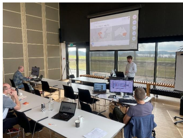
Fra "studiet" i Sorø hvorfra der blev sendt onlinekonference til hele landet.

I den forgangne periode er modul 1 og 2 af den videregående uddannelse i biavl blevet gennemført. Begge moduler varer tre dage (fredag-søndag) og afholdes på Dalum Landbrugsskole. Modul 1 blev afholdt i november 2024 med 22 deltagere, og modul 2 fandt sted i slutningen af januar 2025 med 14 deltagere. Deltagerantallet er flot for et så omfattende kursus, hvor biavlsemner behandles i dybden. Evalueringerne fra deltagerne er meget positive.