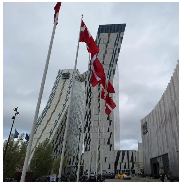
Bella Centret kommer til at danne ramme om Verdenskongressen Apimondia, når de skandinaviske biavlorganisationer er værter i september.

Der er tale om et skandinavisk samarbejde, mellem Norge, Sverige og Danmark. Derfor har en gruppe på 25 frivillige og medarbejdere fra Norge, Sverige og Danmark arbejdet siden 2022 på at skabe denne kongres, hvor der bliver lagt vægt på det sociale og hvor de besøgende får en stor oplevelse omkring biavl fra hele verden. Vi tror det bliver kæmpestort, og vi opfordrer alle biavlere, biavlsinteresserede og lokalforeninger til at deltage aktivt.