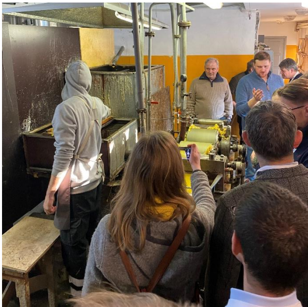
Nordisk-Baltiske Biråd blev afsluttet med et inspirerende virksomhedsbesøg hos lettisk biavlsvirksomhed.

vigtigt, både fordi vi finder et biavlsfællesskab med lande, som på mange måder ligner Danmark, men også fordi birådet kan være et vigtigt forum i forhold til at få håndteret politiske emner i EU.