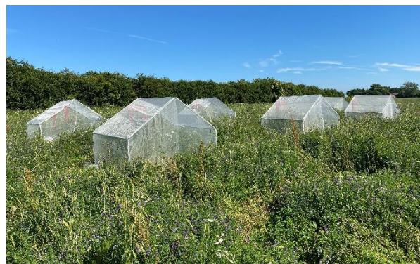
Effekten af bestøvning af Lucerne vurderes ved hjælp bure i marken.

Lucerneprojektet laves sammen med Økologisk VKST, og det er støttet af Fonden for Økologisk Landbrug.