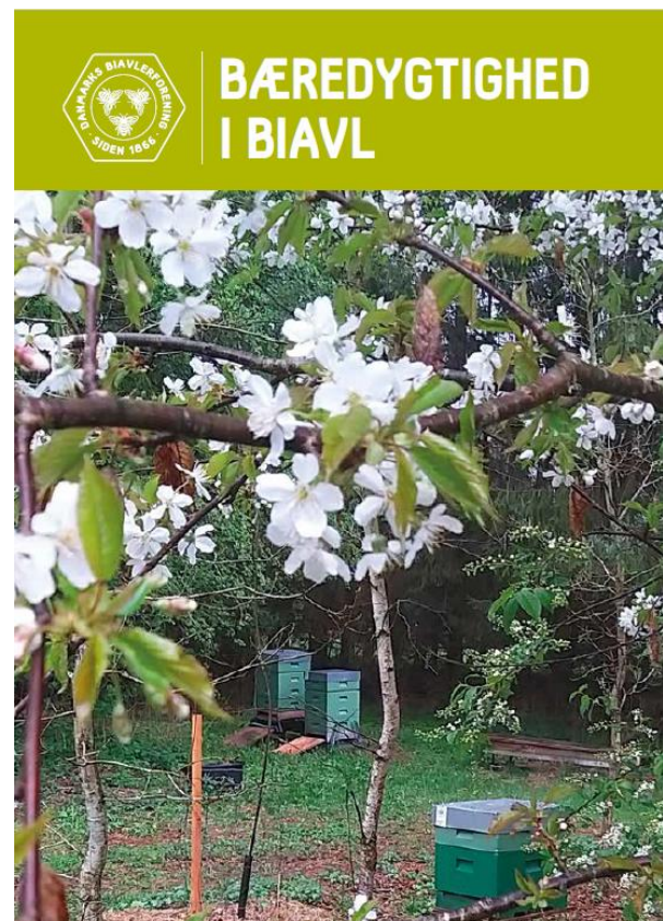
I januar udkom temahæftet "Bæredygtighed i biavl", som inspirerer til, hvordan man kan gøre biavl endnu mere bæredygtigt.

Varroabekæmpelsen i Danmark er udfordret. Vi ser hvert år væsentlige tab af bifamilier som resultat af varroamider og der ses udfordringer omkring effektive bekæmpelsesmetoder. I en bæredygtig varroastrategi bør der også være fokus på at udvikle bier med større modstandskraft mod varroa. Derfor har vi startet et nyt projekt, støttet af Promilleafgiftsfonden, hvor vi i et samarbejde med dronningavlere og biavlere vil arbejde mod udvikling og afprøvning af metoder og strategier til avl af bier med større modstandskraft mod varroamider og derved mindske afhængigheden af bekæmpelse. Udgangspunktet for avlsarbejdet vil være avlsstrategier hvor man måler på forskelle i biernes evne til at holde mide reproduktionen nede. Projektet løber over årene 2025-2027.