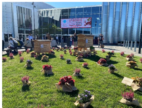
Den stemningsfulde indgang ved verdenskongressen.

Bestyrelsen vil gerne benytte denne plads til at takke for den kæmpe frivillige indsats, som måske ikke er så usædvanlig i en dansk sammenhæng, men som virkelig imponerede Apimondia-organisationen.