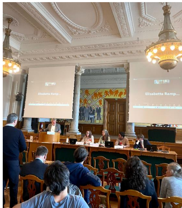
Christiansborg satte rammerne for mødet Pollinating EU, der blev afholdt dagen før Verdenskongressen.

Konferencen samlede på den måde eksempler og anbefalinger til en bedre fremtid for bestøvere i EU på tværs af videnskab, politik og samfundskrav.