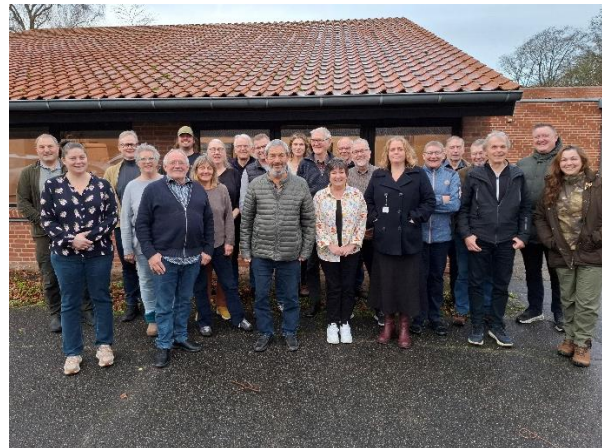
Glade kursister på Modul 1 i Videregående Uddannelse i Biavl på Dalum Landbrugsskole.

De forskellige niveauer gør det lidt vanskeligt at målrette specielt modul 2, men for de, der vil specialisere sig, er der mulighed for at deltage i et af de overbygningsskurse, der bliver udbudt med mellemrum, og som handler om mere specialiserede emner.