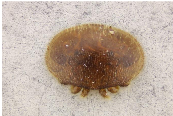
Danmarks Biavlerforening finder det vigtigt at give danske biavlere et bredt udvalg af varroabekæmpelsesmetoder

Danmarks Biavlerforening fortsætter arbejdet for de bedst mulige dyresundhedsregler for biavl på EU-niveau.