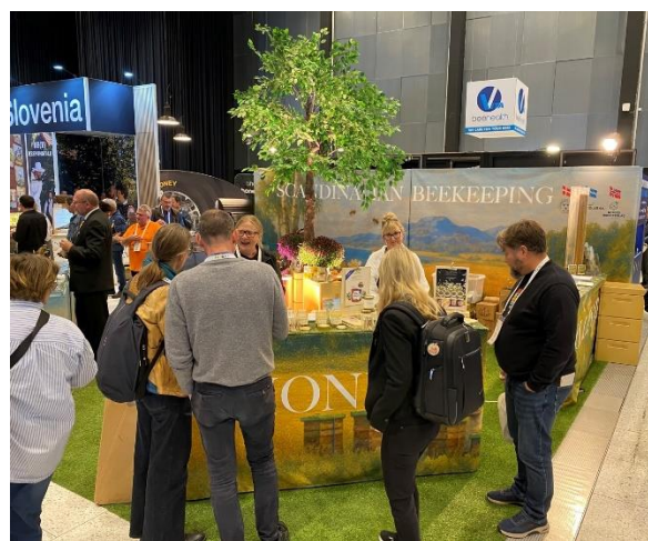
Den Skandinaviske stand ved verdenskongressen.

Der var stor interesse for den skandinaviske stand og for de produkter, der blev præsenteret på standen. Det resulterede blandt andet i aftaler om eksport af dansk honning. Noget andet vi fik ud af den skandinaviske stand var fornøjelsen af at møde gode kollegaer, hvilket førte til ønsket om et øget samarbejde mellem de skandinaviske biavlsforeninger.