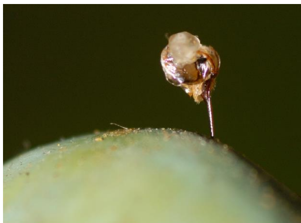
Figur 2: En bibrod med giftsæk i en bihandske.

I sjældne tilfælde kan man selv eller nogen, man kender, være allergisk overfor bistik, og så er det vigtigt at vide, hvad man skal gøre.